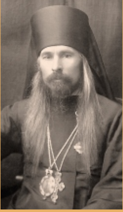
Священномученик Онуфрий (Гагалюк)

Главными апостолами для всего христианского мира являлись продолжатели апостолов – православные святители и пастыри. При осуществлении этой всемирной миссии у служителей Христовых не должно быть уныния, когда они видят озлобление со стороны окружающих. Как бы ни был враждебно настроен против святой веры невер или еретик – и он может поддаться действию благодати Божией, лишь бы только у проповедника Христова была крепкая любовь к заблуждающимся и неустанность в труде.